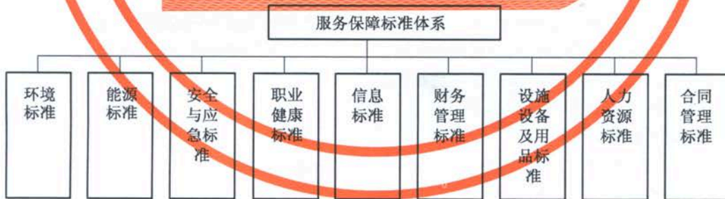
图 3 服务保障标准体系结构图