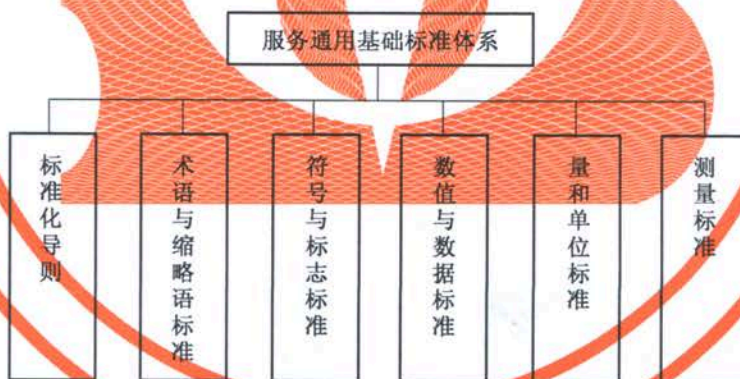
图2 服务通用基础标准体系结构图